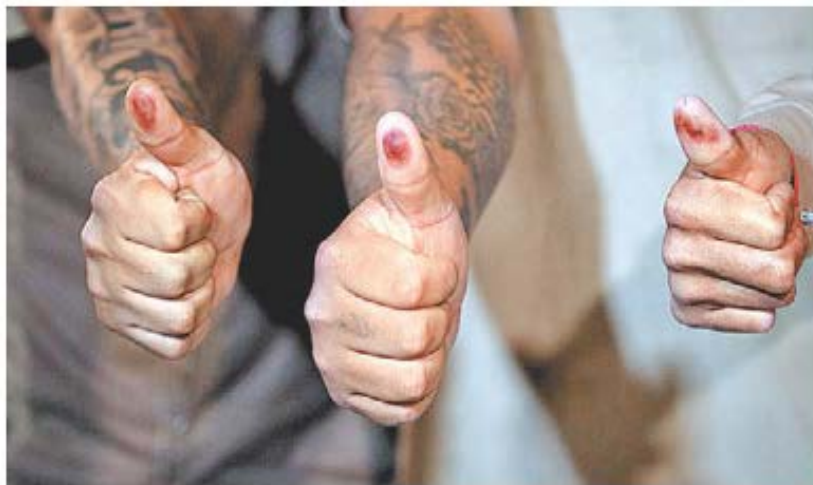
Reos muestran sus pulgares con tinta indeleble.