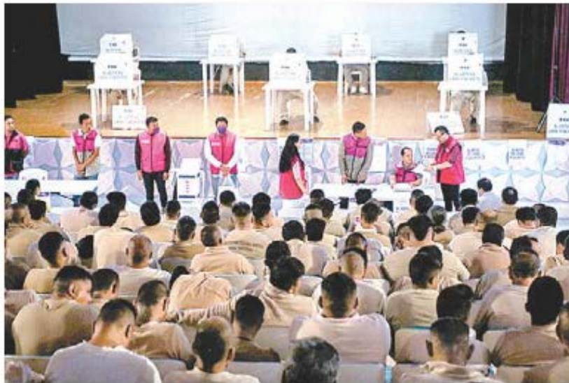
Casillas especiales en el Reclusorio Norte.