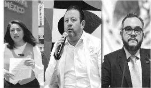
Van tres aspirantes por la Alcaldía

Desde la Comisión de Quejas del IECM, la representante del movimiento naranja, Nit-