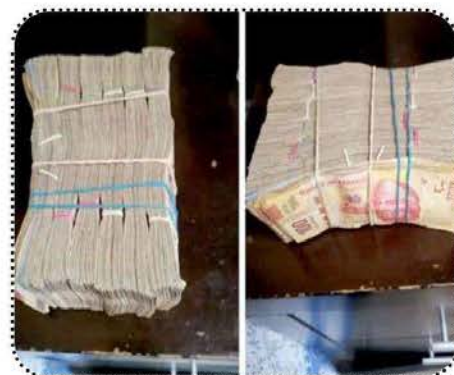
Fajos de billetes entregados a funcionarios de Profeco

cantidad mensual para no ser molestados mediante visitas de verificación... Llegan los verificadores a las empresas y les exigen una cantidad para que todo salga bien", relató quien fuera gerente de una compañía distribuidora de gas con presencia en distintos estados, de quien Mexicanos Contra la Corrupción y la Impunidad (MCCI) se reserva su identidad por motivos de seguridad.