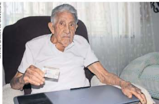
Don Jesús señaló que poder votar significa estar con México, porque “es nuestra obligación participar”.