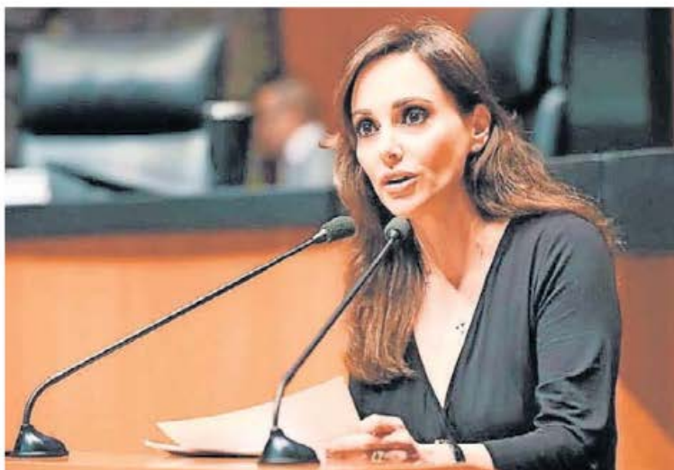
La senadora panista Lily Téllez expresó sus opiniones dentro del noticiario radiofónico Ciro por la mañana .