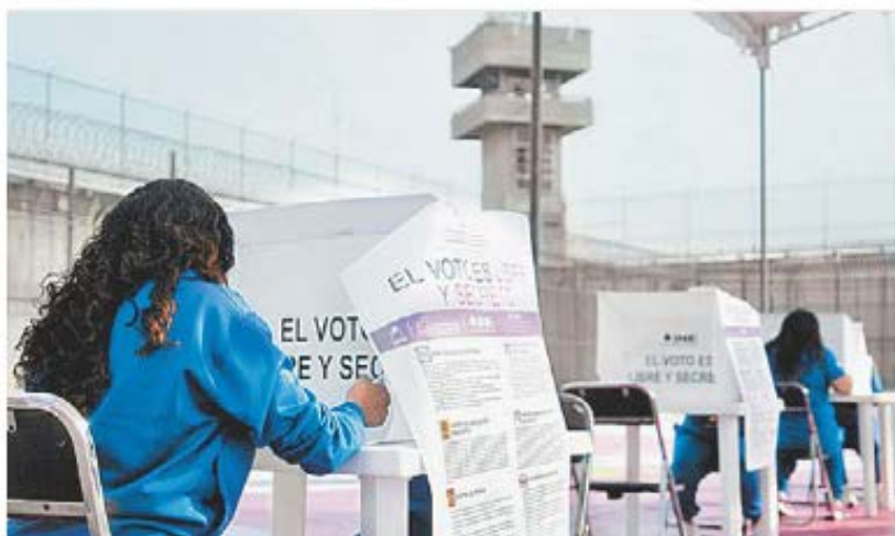
Internas del penal de Neza Bordo.